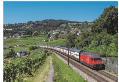
Lok Re 460 mit IC2000-Wagen, Bild: Julian Ryf