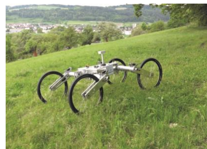
Prototyp im Testeinsatz.