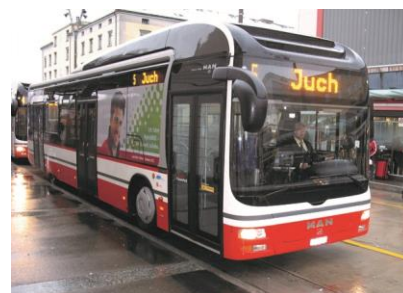
Ein Stadtbus der Linie 5 Juch am Bahnhof Frauenfeld, mit welcher die Erschliessung des Entwicklungsgebiets Langdorf sichergestellt wird.