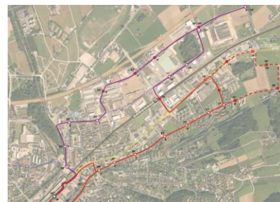
Die Linienführung der Bestvariante gewährleistet ideale Umsteigebeziehungen am Bahnhof Frauenfeld sowie an der geplanten S-Bahn-Haltestelle Langdorf