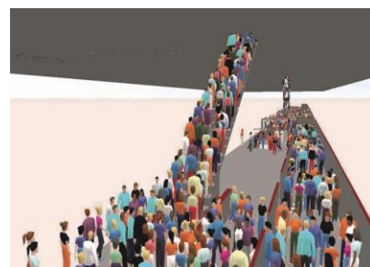
3D-Visualisierung eines simulierten ISB-Zuges in Vierfachtraktion im Bahnhof Hardbrücke.