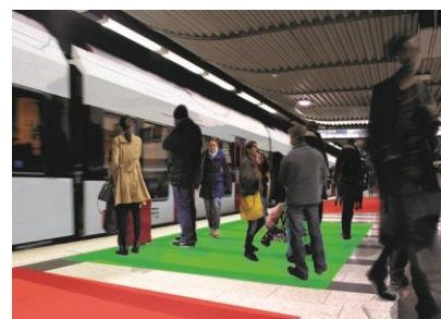
Definierte Warte- und Freihaltezonen für ISB-Züge auf dem Bahnsteig im Bahnhof Museumstrasse.