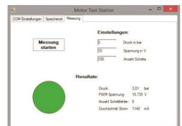
Benutzeroberfläche des Bedienprogramms