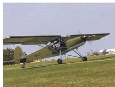
Morane Saulnier MS 505 "Criquet"