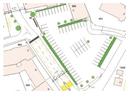
Parkplatzsituation beim Bahnhof Nidau