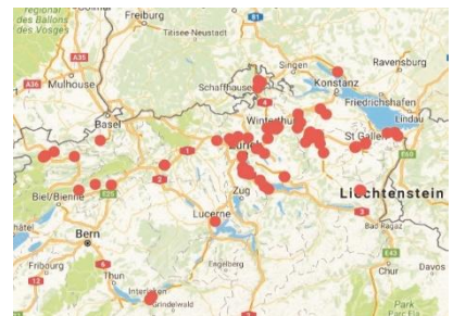
Abbildung 1 zeigt einen Ausschnitt der Start- und Endpunkte von Fahrten eines Mitarbeiters der Versicherung. Die Daten werden anhand der Geo-Koordinaten mit dem Geocustering-Algorithmus DBSCAN geclustert