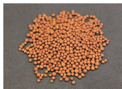
Der für den Sorptionsreaktor benötigte Eisenkatalysator nach der Synthese