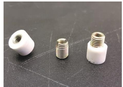
Insert-Rohlinge mit Klebstoff ummantelt