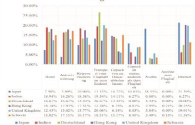
Bevorzugte Dienstleistungen der Passagiere

Kaufbereitschaft der Passagiere, von Produkten und Dienstleistungen, wenn diese von den Fluggesellschaften angeboten werden