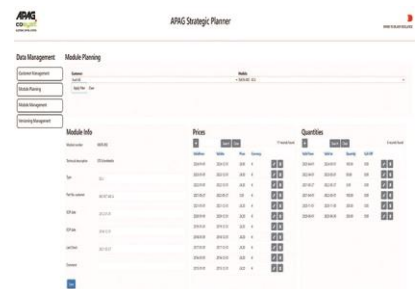
Screenshot aus der implementierten Webapplikation. Abgebildet ist die Modulplanungsseite, welche alle relevanten Informationen zu einem spezifischen Modul darstellt. Sie ist eines der zentralen Elemente der strategischen Fünfjahresplanung.