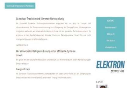
Mitgliederprofil der Firma Elektron AG