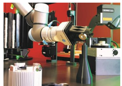
Maschinentisch der gebauten Magnetttestmaschine mit verschiedenen Prüfstationen