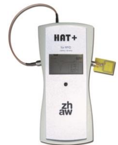
Die HAT+ kann sowohl die Abstimmung von Antennen überprüfen, als auch das Anpassungsnetzwerk für noch unbestückte Antennen ermitteln.